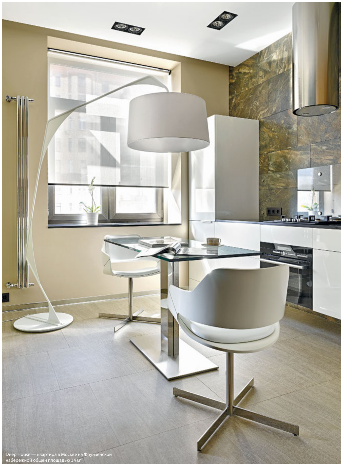
Deer House — квартира в Москве на Фрунзенской набережной общей площадью 34 м 2