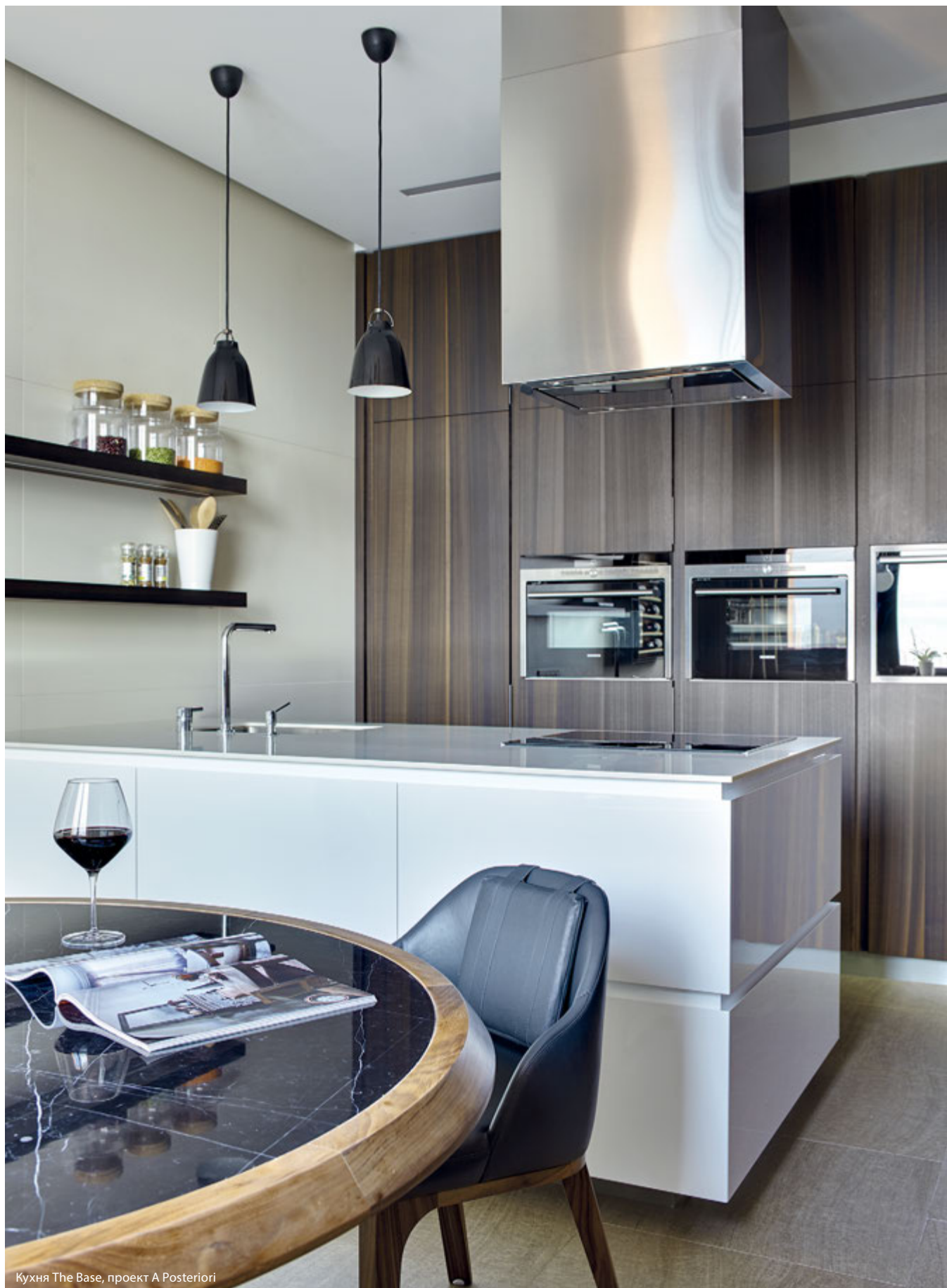
Кухня The Base, проект A Posteriori