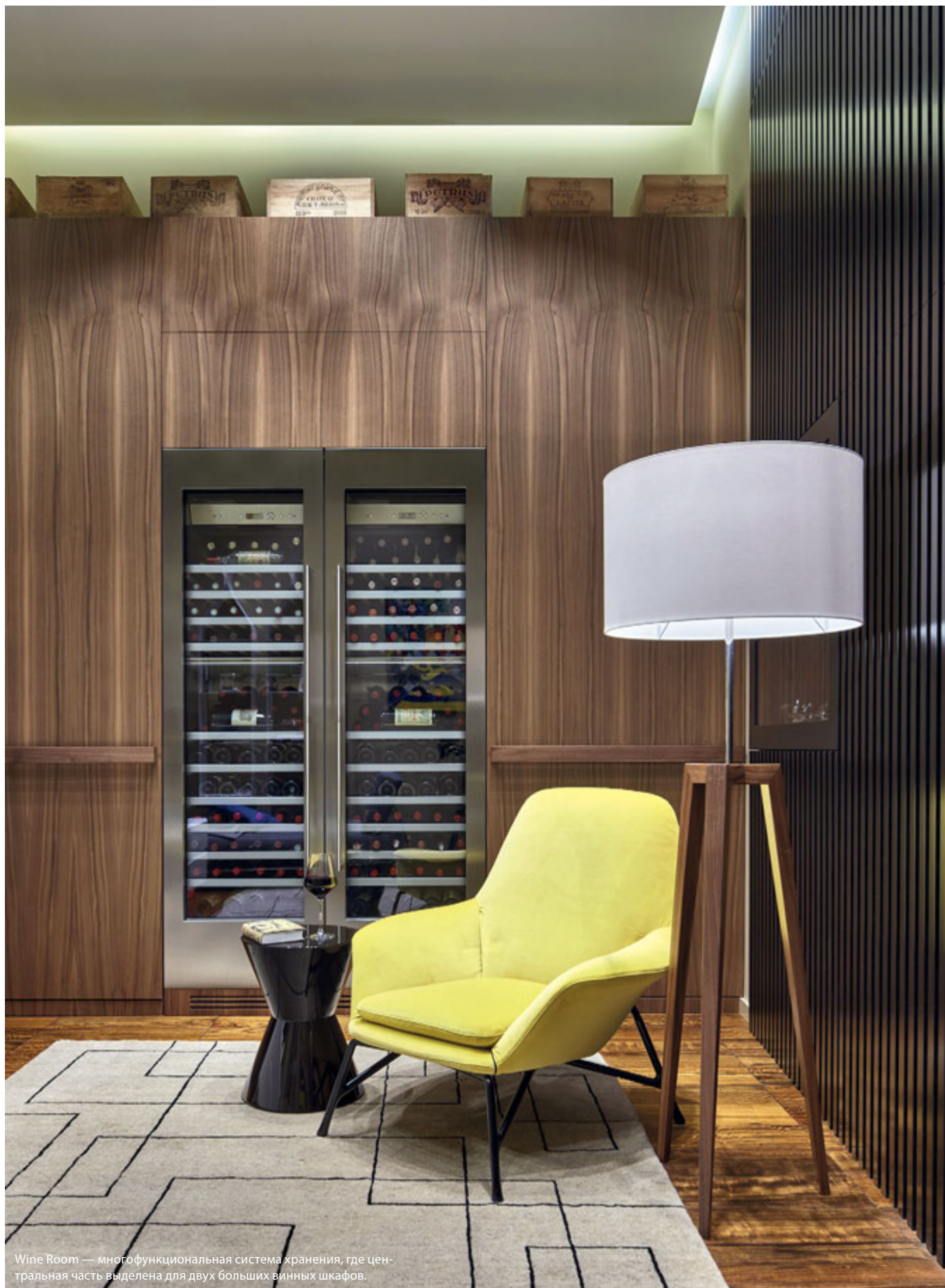
Wine Room — многофункциональная система хранения, где центральная часть выделена для двух больших винных шкафов.