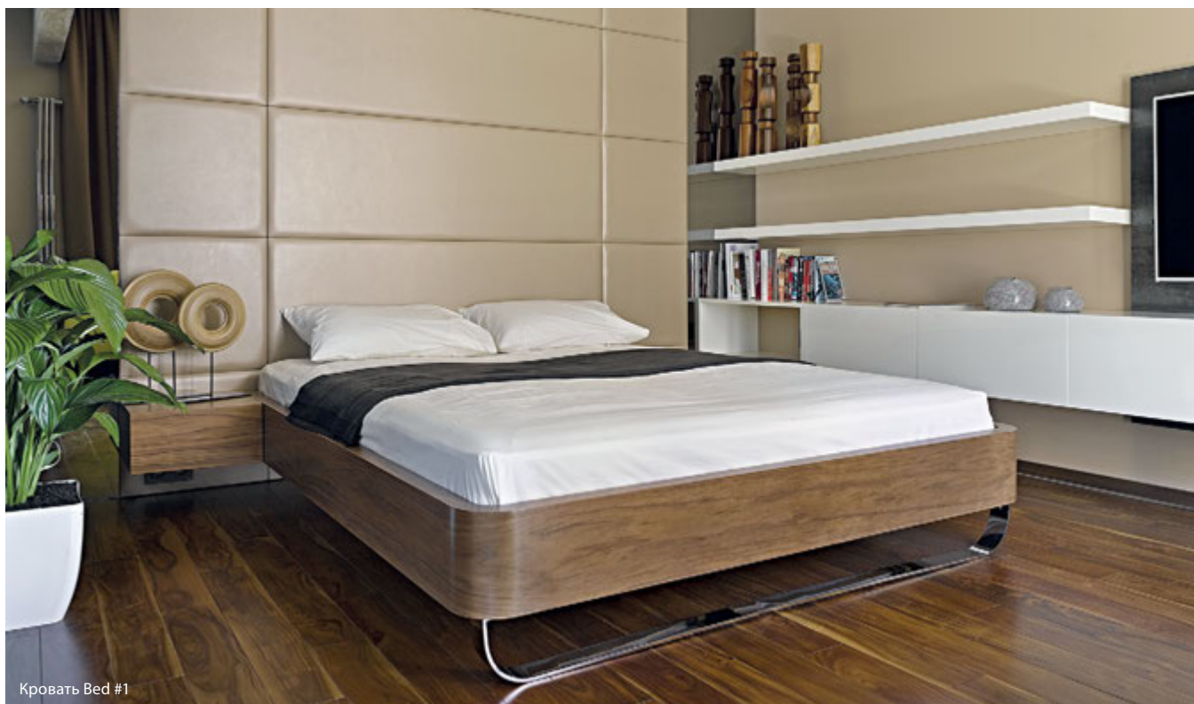
Кровать Bed #1

В 2016 году студия Max Kasymov представила свою первую коллекцию мебели на трех крупных европейских выставках: Maison&Objet Paris, 100%Design London и iSaloni WorldWide Moscow.