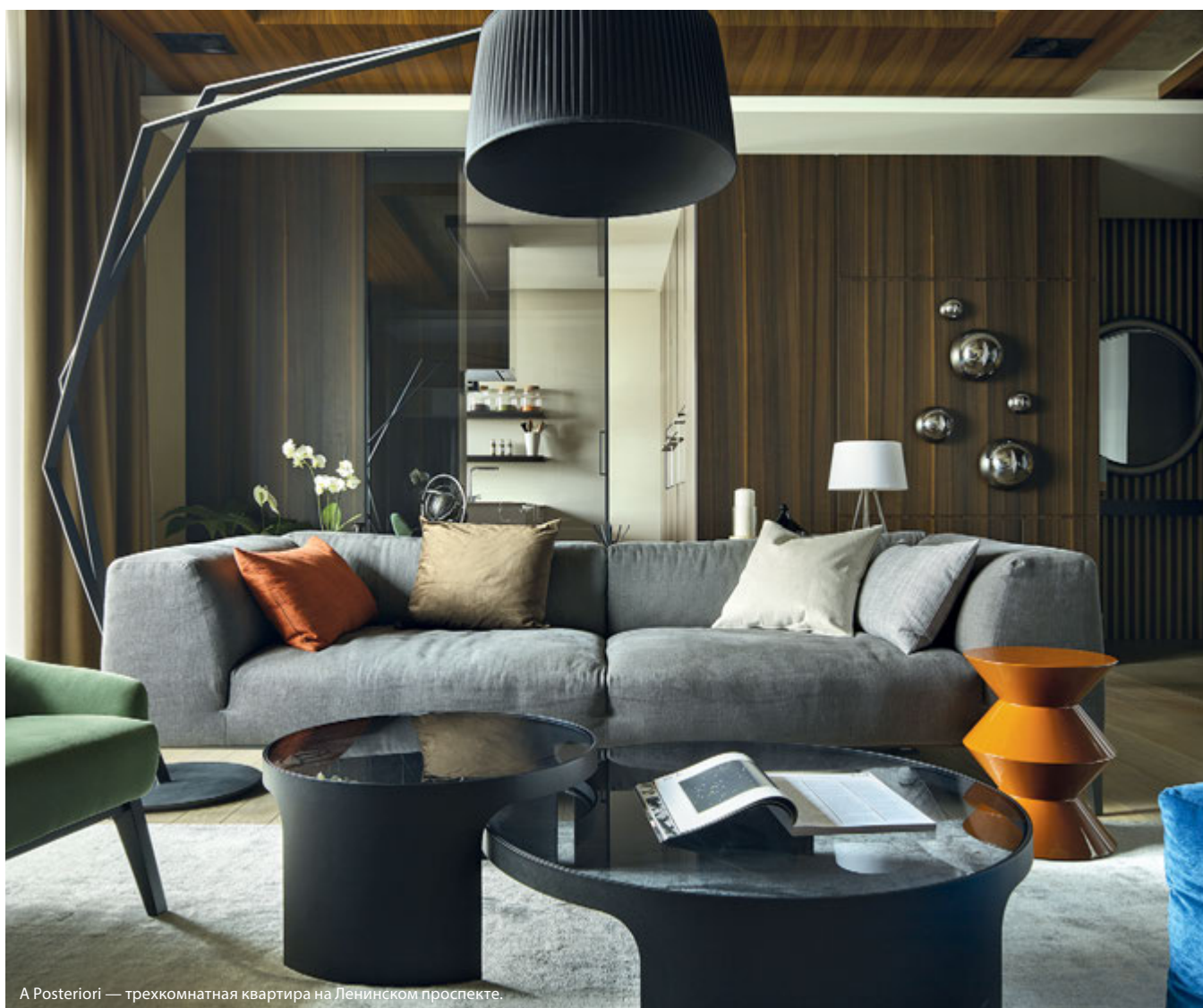
A Posteriori — трехкомнатная квартира на Ленинском проспекте.